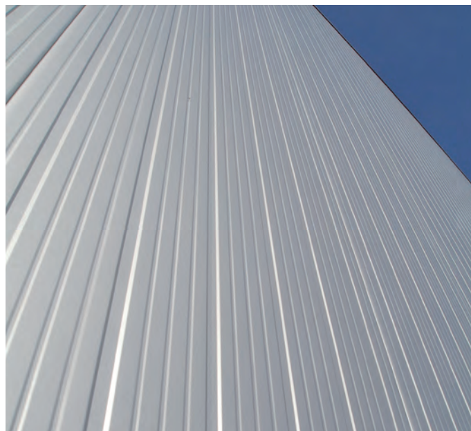
Calcoli effettuati su pannello con paramenti di acciaio 0,4 + 0,4 mm * (a 8 giorni da produzione / 8 days from production)